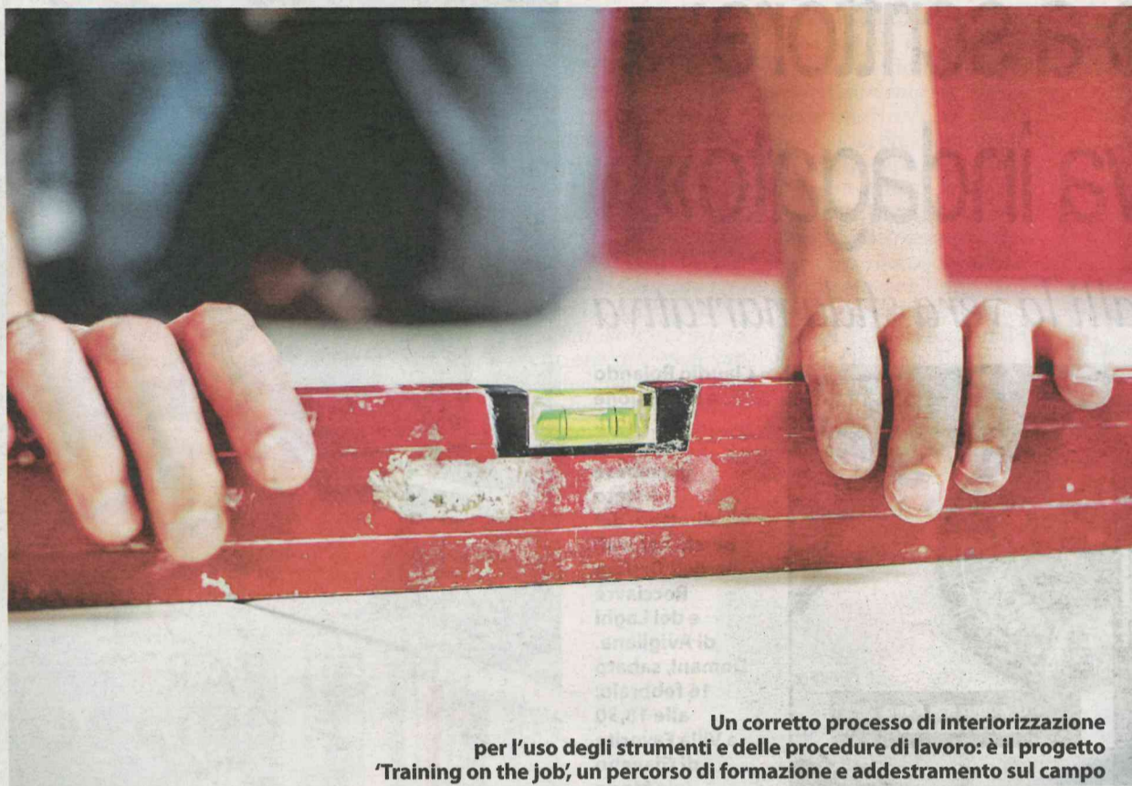
Un corretto processo di interiorizzazione per l'uso degli strumenti e delle procedure di lavoro: è il progetto "Training on the job", un percorso di formazione e addestramento sul campo

Corsi ideati dalla EcoSafe di Rosta e dall'Azimut di Avigliana