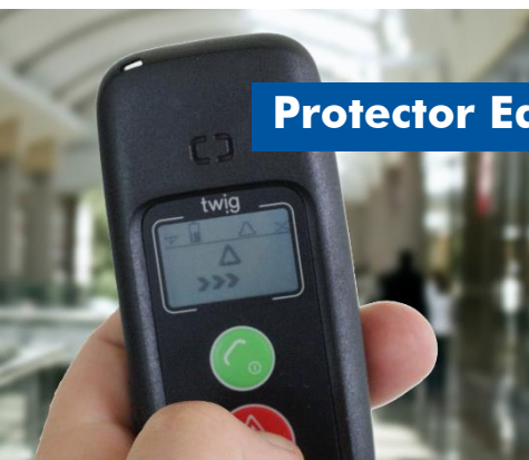
Protector Easy S